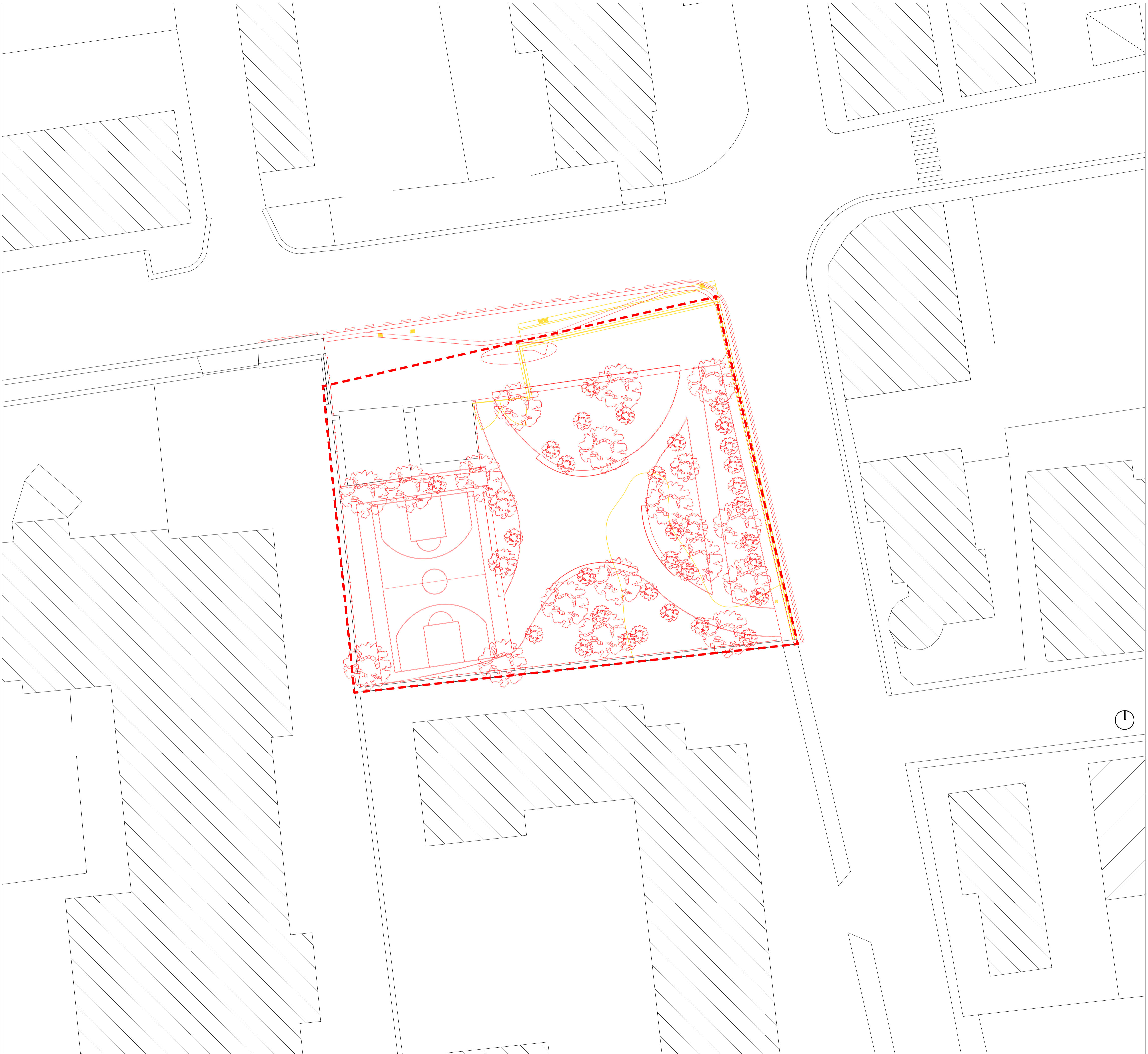
Pianta demolizioni e ricostruzioni - scala 1:200