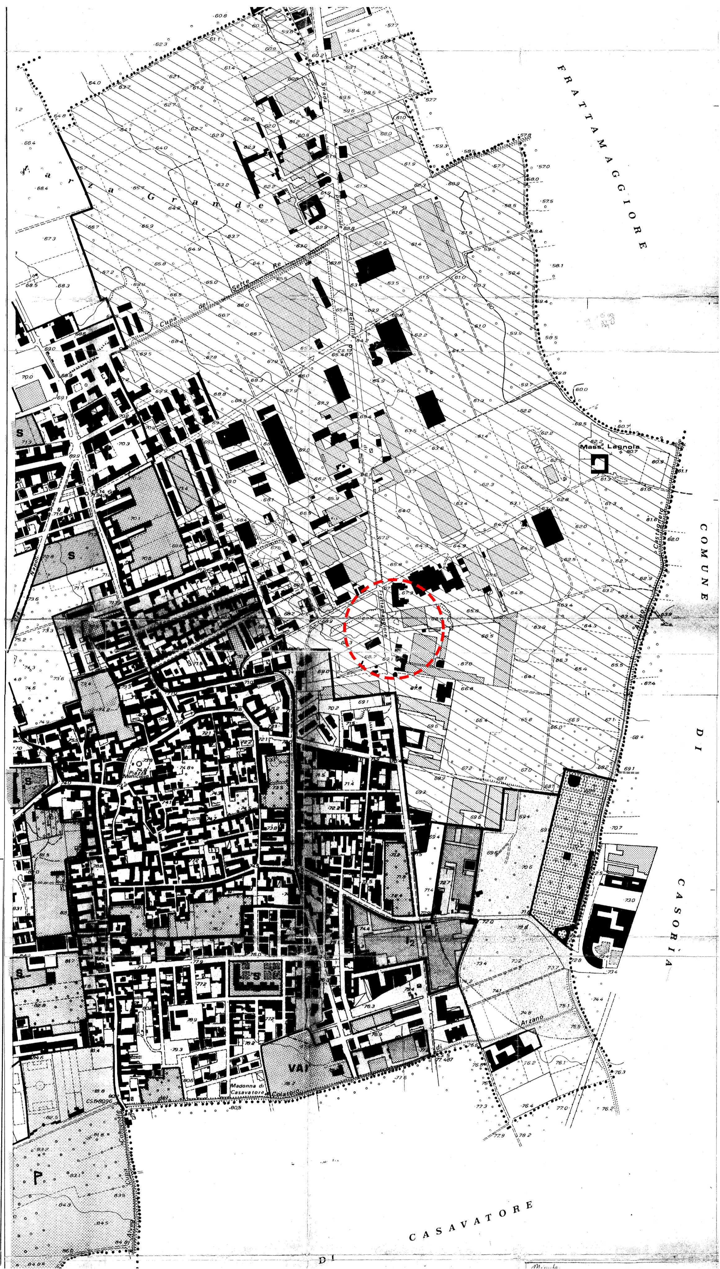
Stralcio Piano di Fabbricazione