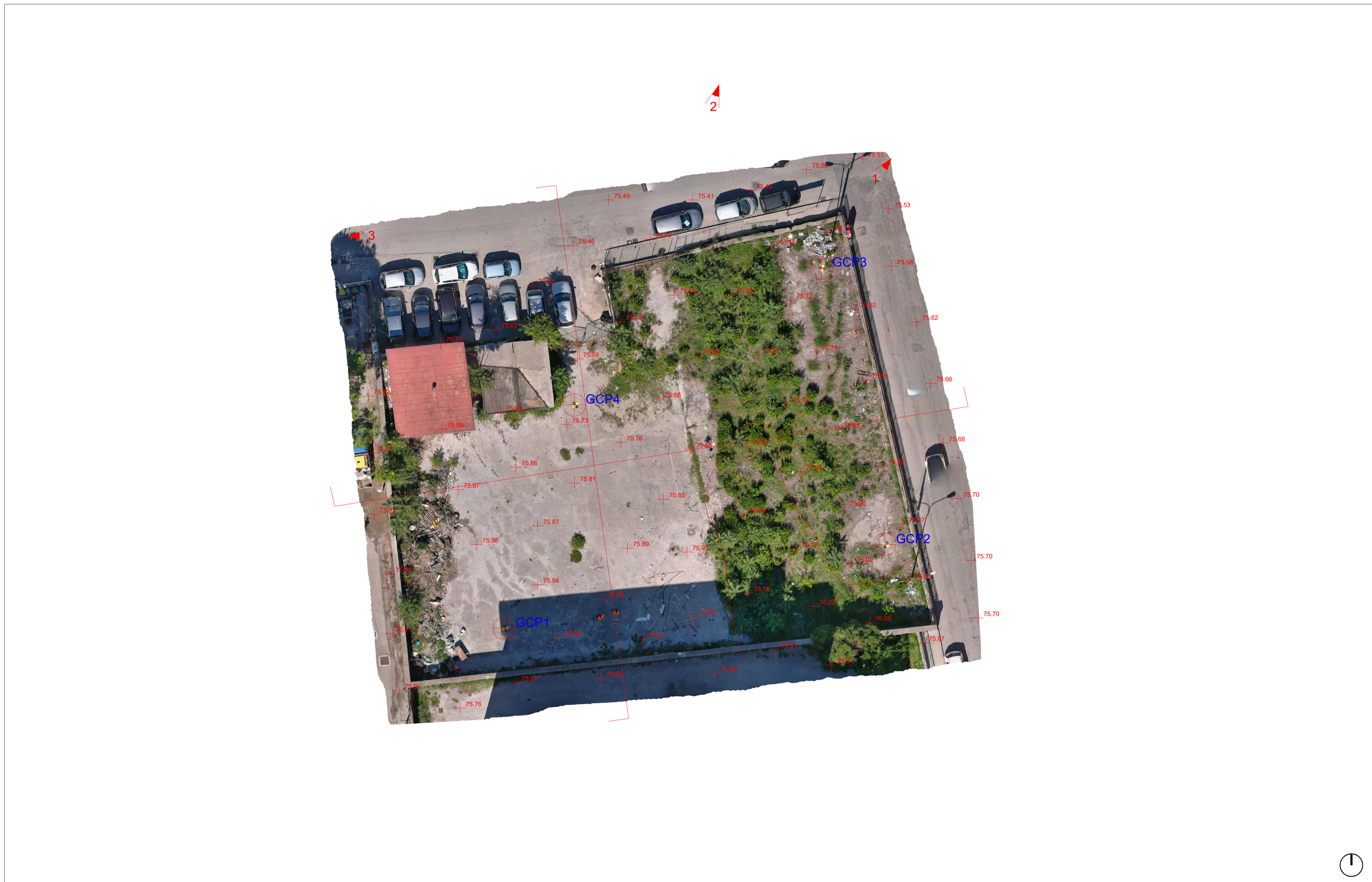
Ortotofo- stato di fatto - scala 1:200