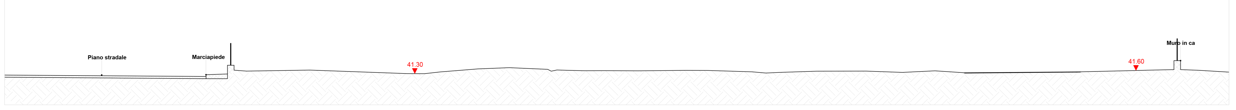
Profilo altimetrico AA'- stato di fatto - scala 1:200