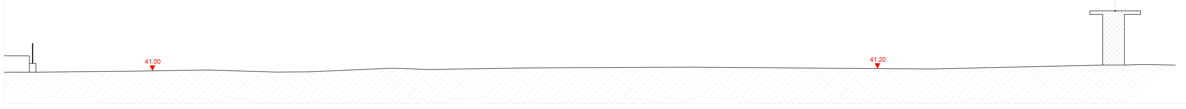
Profilo altimetrico BB'- stato di fatto - scala 1:200