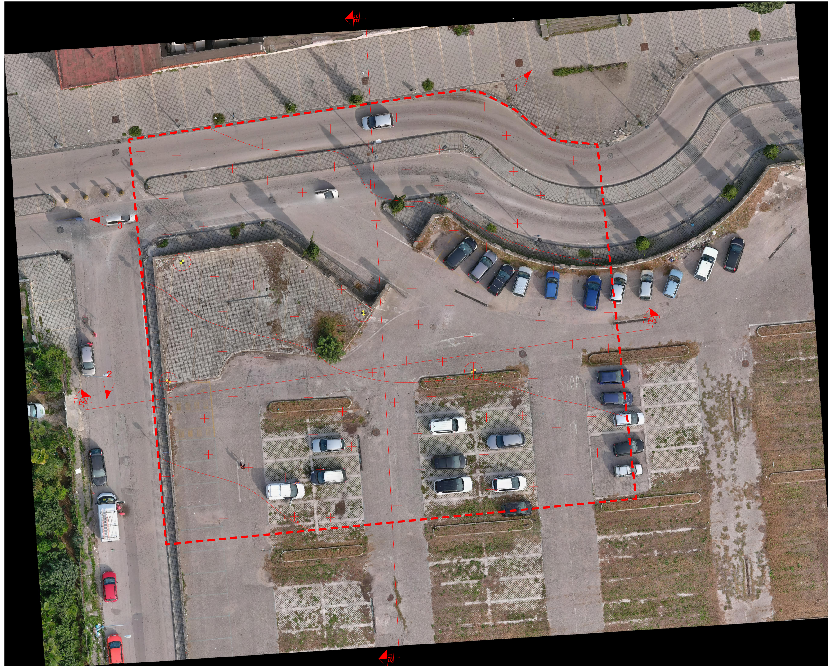
Ortofoto - stato di fatto - scala 1:200