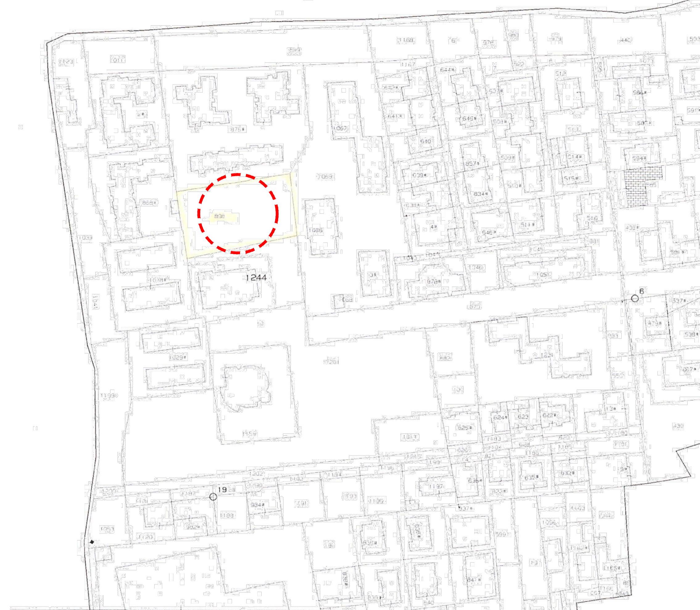
Stralcio mappa catastale - foglio 1 p.la 898