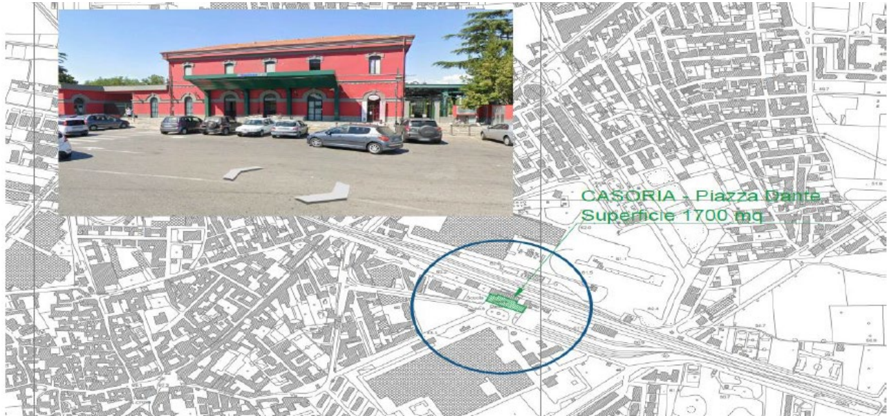
Figura 1. Collocazione territoriale area di intervento

Si riporta di seguito l'inquadramento satellitare del sito e del complesso.