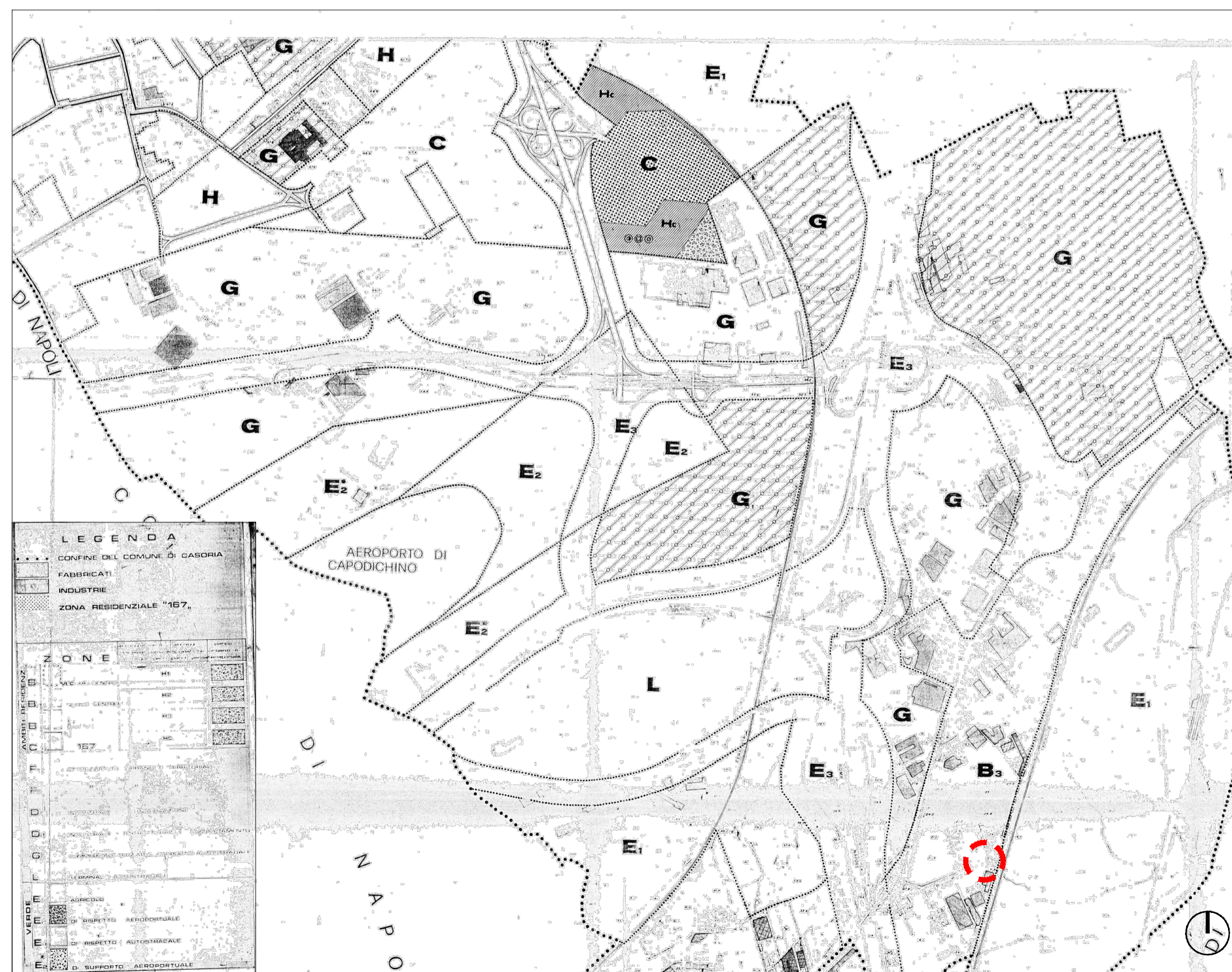
Stralcio variante PRG 1988