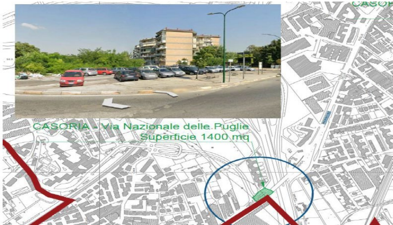
Figura 1. Collocazione territoriale area di intervento

Si riporta di seguito l'inquadramento satellitare del sito e del complesso.