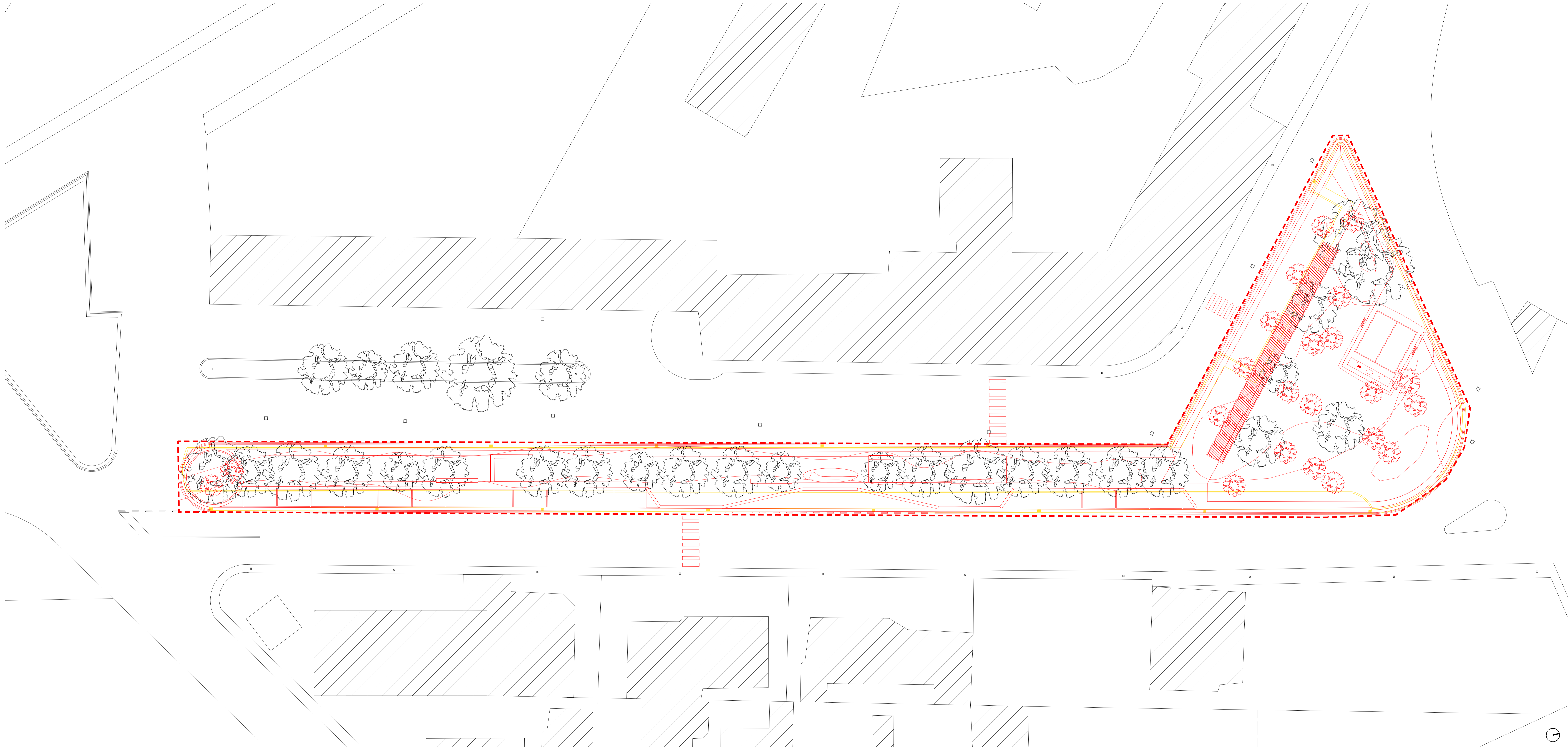
Pianta demolizioni e ricostruzioni - scala 1:200