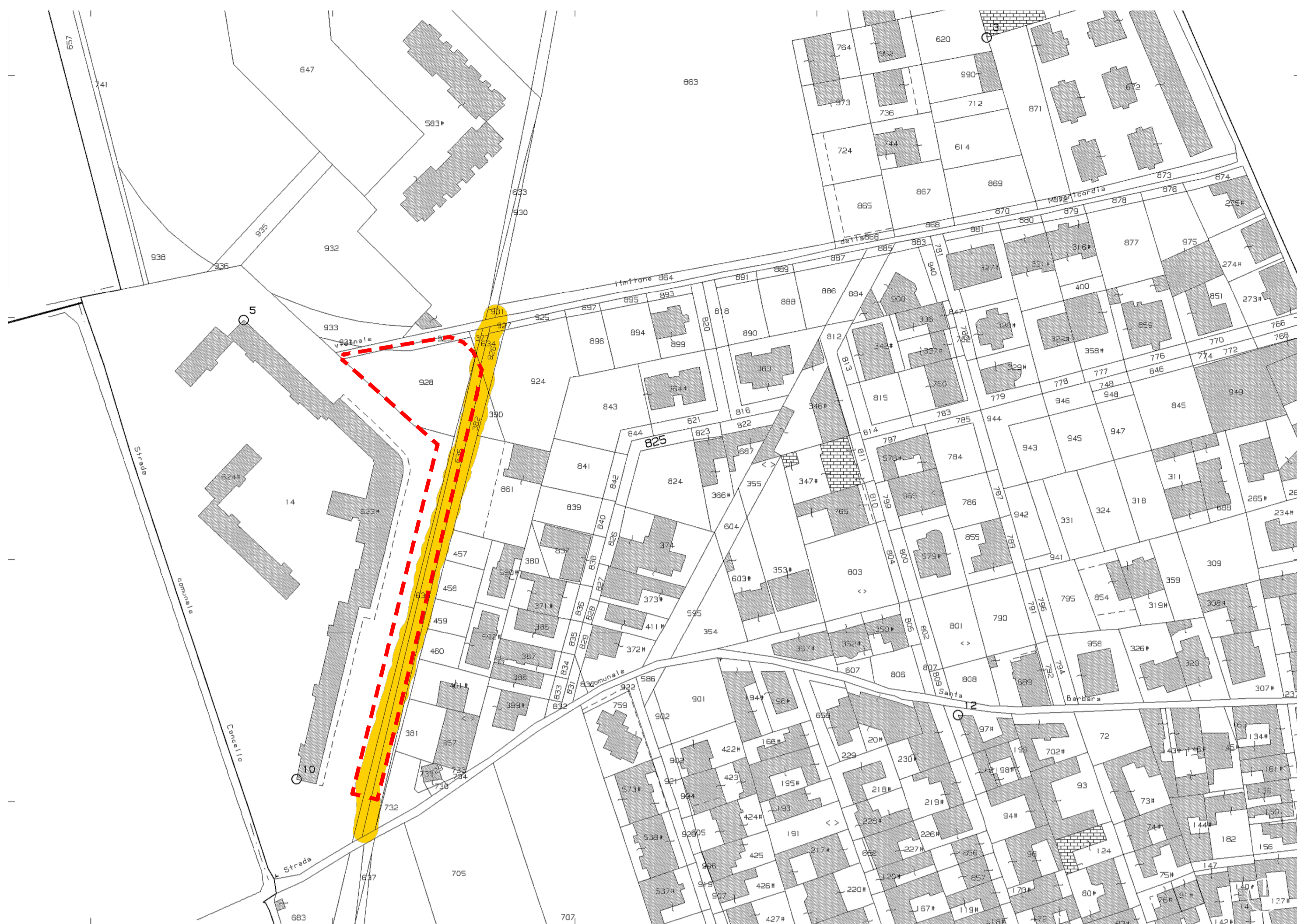
Stralcio mappa catastale - foglio 2 p.lle 635, 636, 382, 928, 929