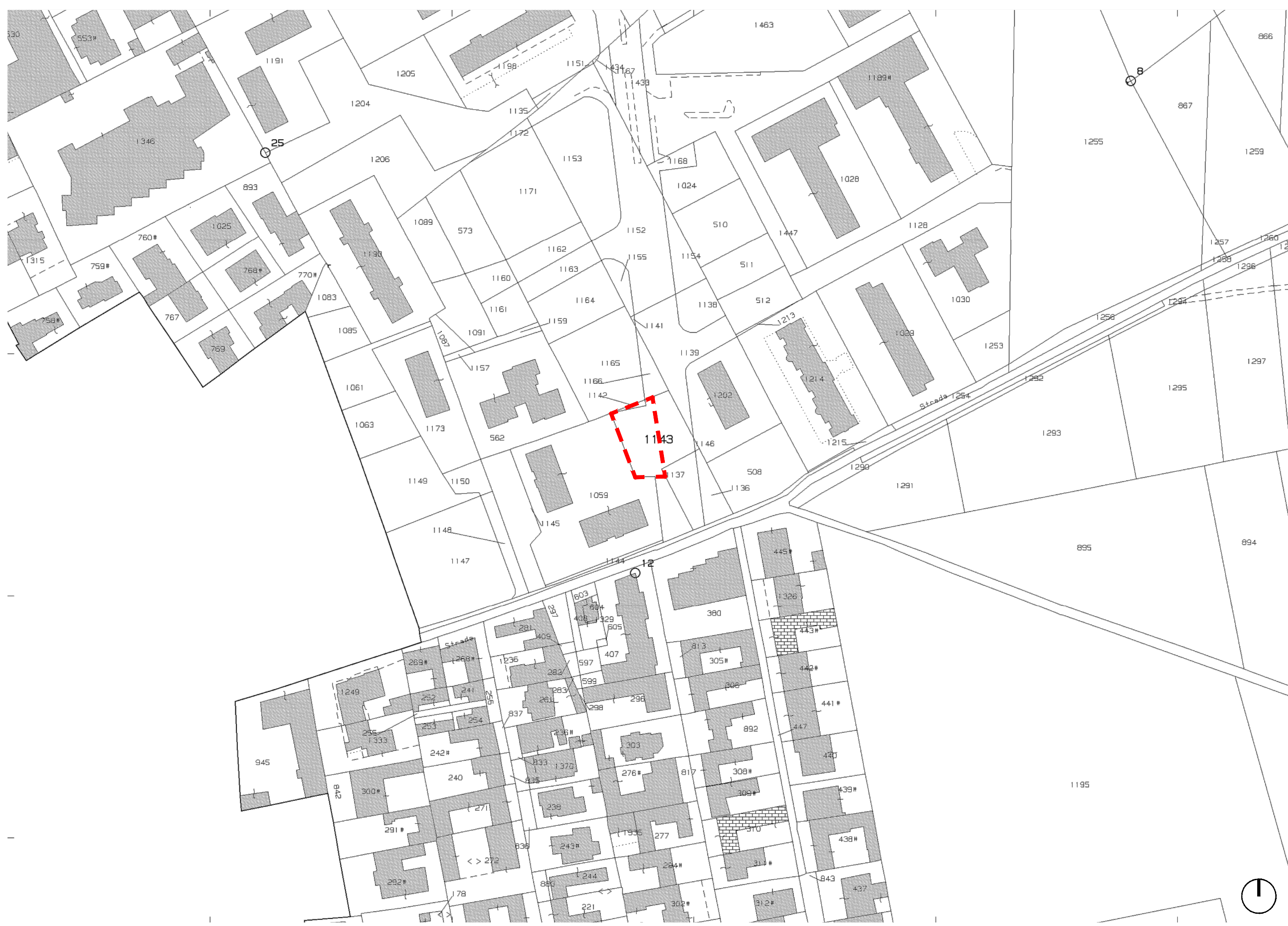
Stralcio catastale - foglio 1 p.IIa 1143

Comune: Frattaminore Lotto: Via F. Turati Codifica: FTM Superficie: 440 mq