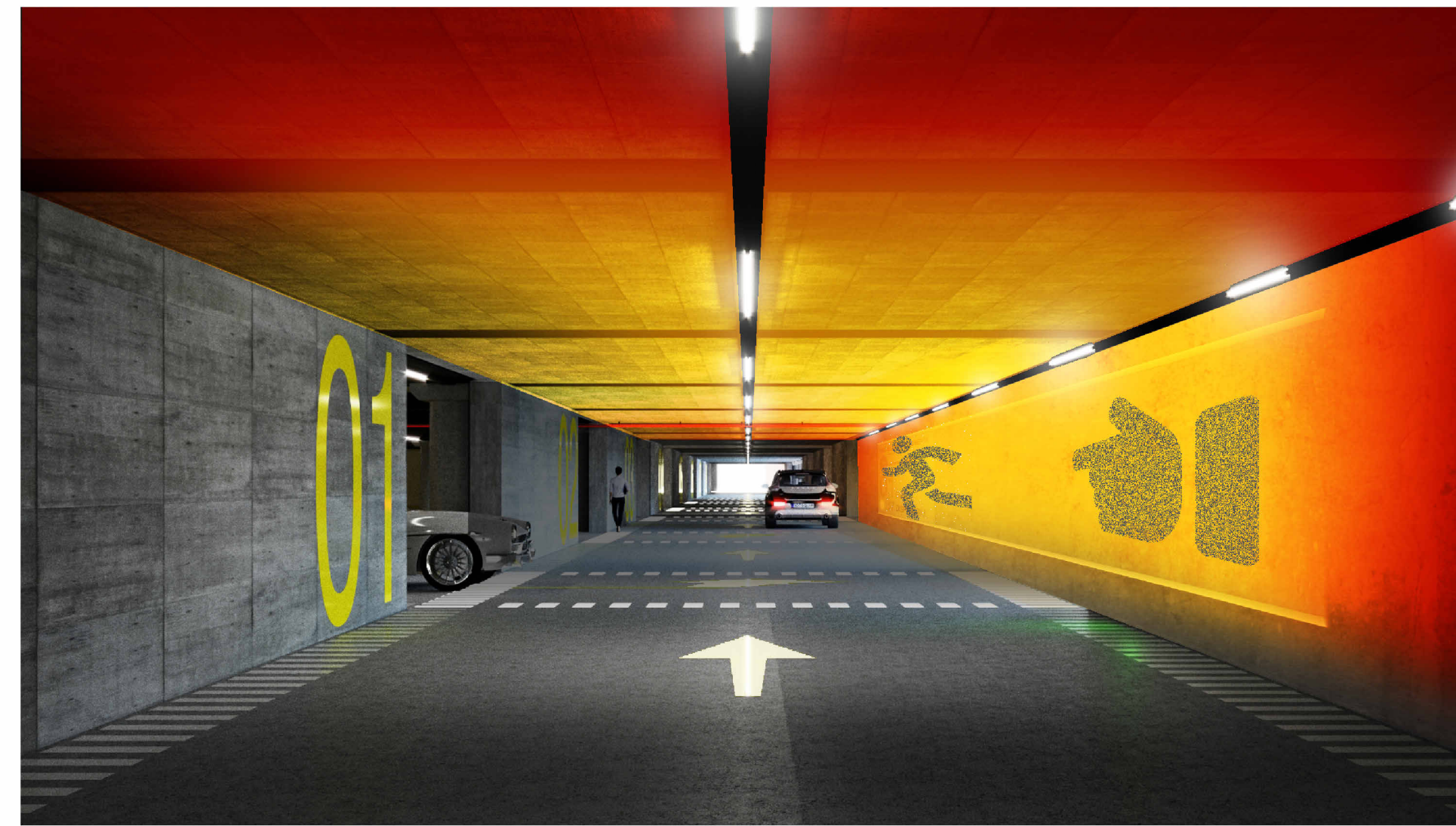
Vista garage 2