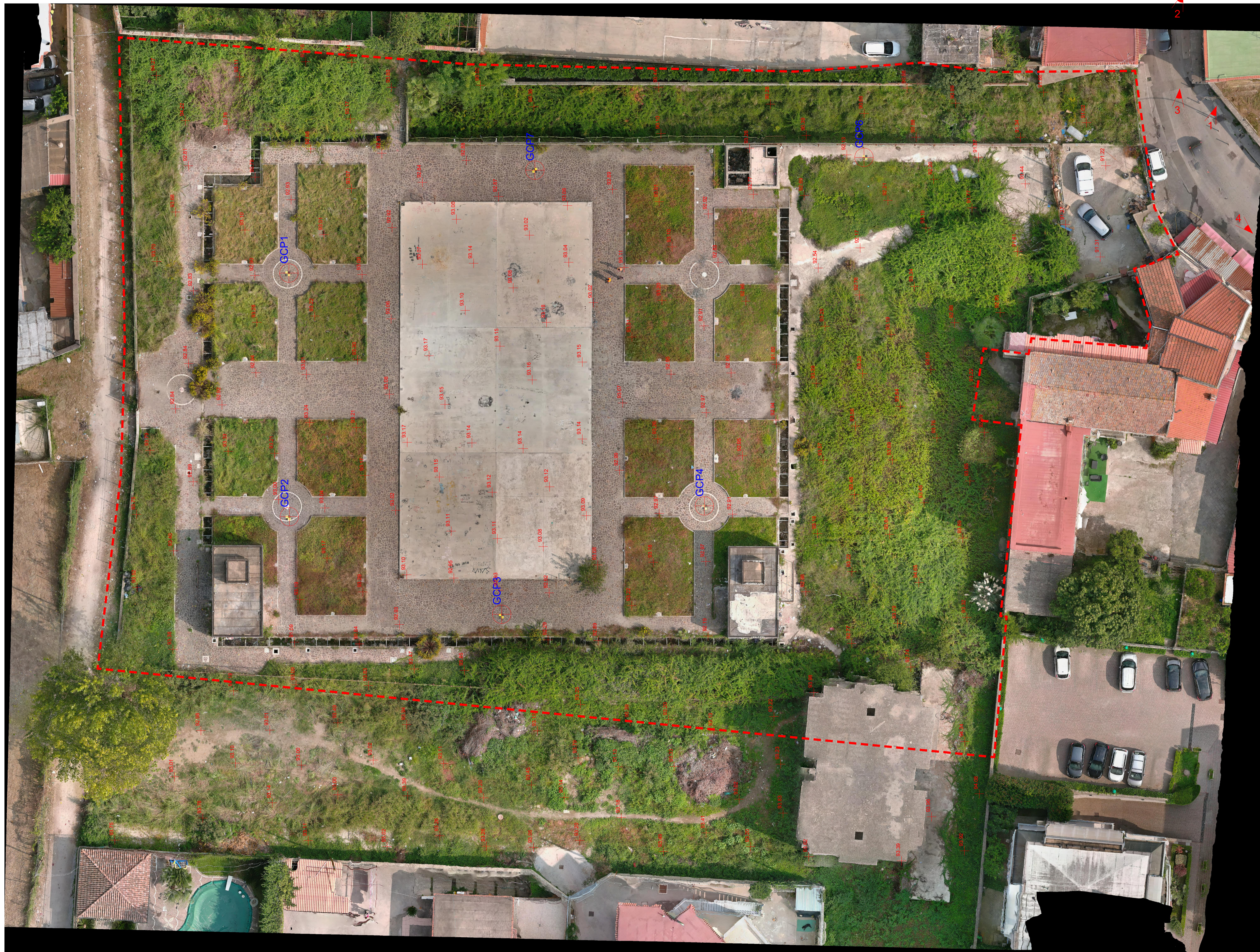
Ortoto-foto - stato di fatto - scala 1:200